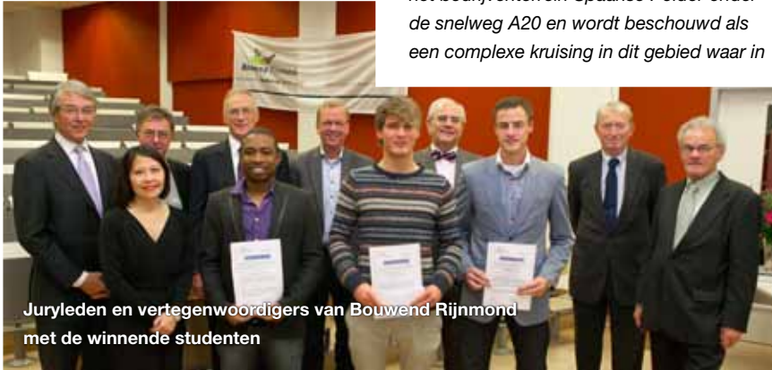
Juryleden en vertegenwoordigers van Bouwend Rijnmond met de winnende studenten

Er is door één student een uitgebreide, goed gestructureerde, heldere en overzichtelijke rapportage gemaakt, waarin een gedegen analyse is opgenomen evenals de mogelijke fasering van uitvoering van het werk. De ligging van de riolering is wel vermeld, die van kabels en leidingen ontbreekt echter. Een financiële onderbouwing is er niet, maar "duurzaam veilig verkeer" gaat voor alles waardoor dit aspect minder relevant is. In de rapportage worden oplossingen -zoals de aanleg van een quatronde- aangegeven die direct praktisch uitvoerbaar zijn.