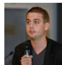
Studenten van de Hogeschool Rotterdam lichten hun PIP toe.